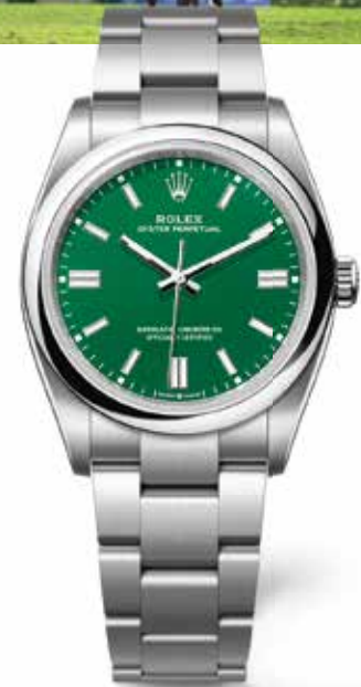
OYSTER PERPETUAL 36

It's the ultimate achievement for any rider. Considered as the greatest challenge, the Rolex Grand Slam of Show Jumping is comprised of the world's four most prestigious tournaments. To secure this trophy, there is a simple rule: win at least three of these Grands Prix in a row. An extremely arduous quest. A legend to write.