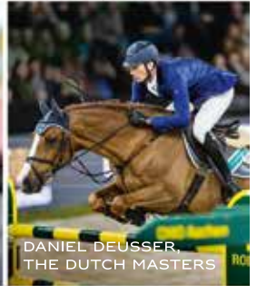
DANIEL DEUSSER, THE DUTCH MASTERS