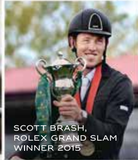
SCOTT BRASH, ROLEX GRAND SLAM WINNER 2015